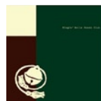
Ringin' Bells Rondo Club